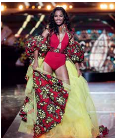
Miss France 2020, Clémence Botino, sera à Gorron samedi 28 mars.

Afin d'élire Miss Mayenne 2020, chaque spectateur recevra un bulletin de vote à l'entrée et devra le remettre dans une urne à l'entracte.