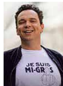
L'humoriste Yann Guillaume est attendu à l'Espace Colmont.

Les Amis d'AL Foncent, en partenariat avec l'hôtel Le Bretagne, sont heureux de vous convier à leur traditionnelle Soirée Cabaret, samedi 7 mars, 19h30, à l'Espace Colmont.