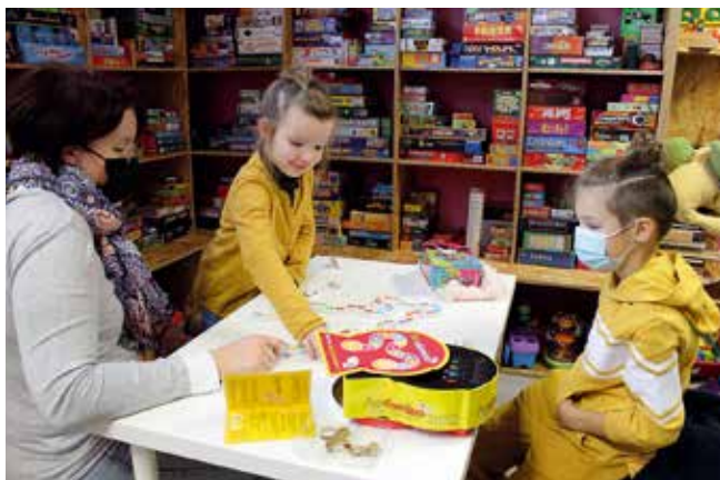
La ludothèque est ouverte les mercredis, de 10h à 18h, et le 1 er samedi du mois, de 10h à 12h

Pour apprendre, passer un bon moment en famille, se défier entre amis, tisser des liens, créer, s'amuser... il y a plein de bonnes raisons de se mettre autour d'un jeu. Ça tombe bien, la ludothèque en compte plus de 1 000 !