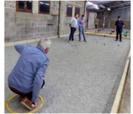
Le concours de pétanque en doublette, organisé par Gorrion Pétanque, a rassemblé douze équipes.

Un concours de pétanque le 3 décembre, l'événement "Gorrion en lumières" le 26 novembre et une vente de chocolats dans les écoles ont permis de récolter 661€ au profit du Téléthon.