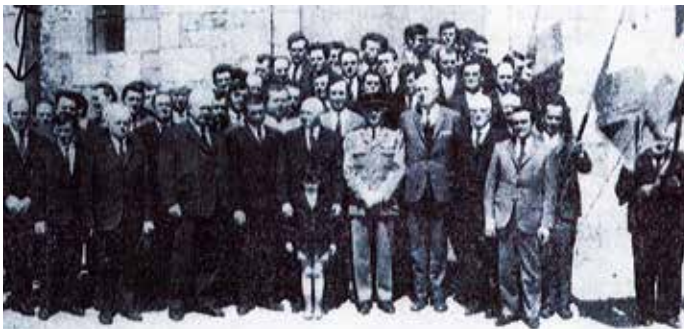
Le 20 décembre 1970, l'Amicale des Anciens Combattants d'Hercé - Gorrion était créée.