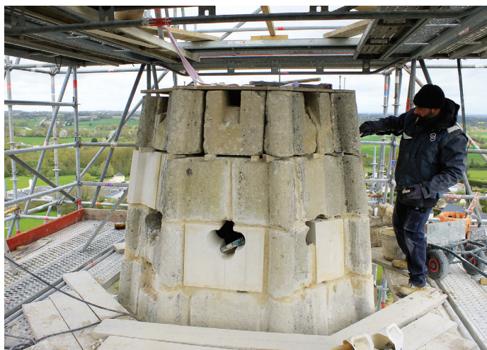
A 43 mètres au dessus du sol, l'extrémité de la flèche a été enlevée pour être reconstruite et sa base (photo) a été solidifiée.

Lancés en décembre, les travaux de l'église sont entrés dans leur phase finale et devraient s'achever avant l'hiver. Les pierres altérées et fragilisées par le temps et les intempéries ont été remplacées, une par une. La base qui supporte l'extrémité de la flèche de l'église a été renforcée. L'extré-