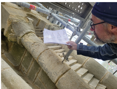
Chaque pierre abîmée est enlevée pour être remplacée par une nouvelle, taillée dans l'atelier de la Maison Grevet, à Laval, ou sur place.

Si l'essentiel des travaux, et la partie la plus spectaculaire, concerne la flèche, c'est toute l'église qui a reçu des améliorations : abat-sons, gouttières, chéneaux et toiture ont été en partie renouvelés, des escaliers dans le clocher ont été changés et l'horloge et le paratonnerre le seront par la suite. Les murs ont été lavés à l'eau chaude haute pression et les portes seront repeintes.