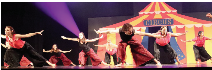
L'année dernière, le thème du gala était "circus".

Toujours spectaculaire, avec des décors et des costumes somptueux, le gala de Gorrion Danse est attendu les 8 et 9 juin à l'Espace Colmont.