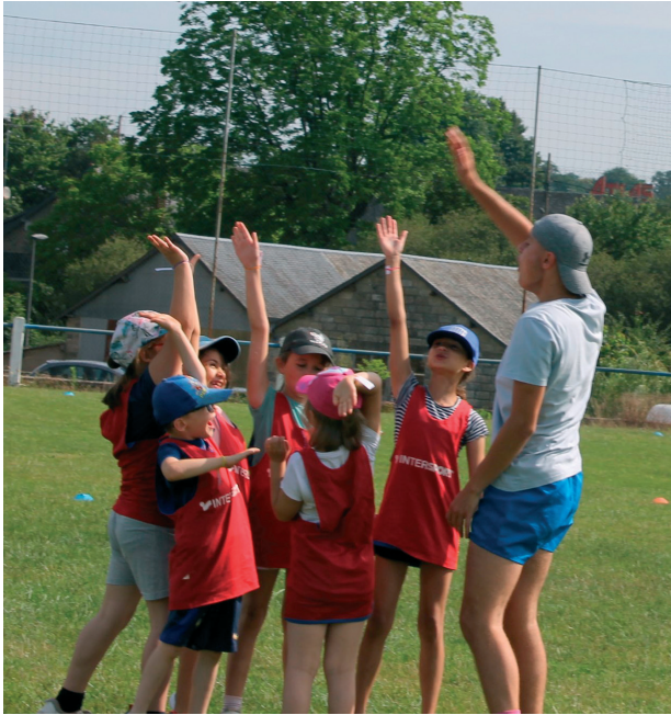
L'année dernière, plus de 400 élèves étaient réunis autour d'une douzaine d'activités sportives comme ici le rugby.

Gorron aura sa flamme olympique vendredi 21 juin : celle de l'Olympiade ! Plus de 550 élèves gorronnais de maternelle, élémentaire et collège sont attendus au Complexe sportif Maurice-Dufour pour partager des moments de jeux et de découvertes sportives. Pour sa 2 e édition, l'Olympiade accueillera également près de 20 résidents de l'Ehpad et des usagers du Centre de jour pour personnes adultes handicapées de Gorron.