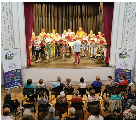
La chorale de la Lyre Gorrionnaise se produira à 19h30 sur la scène du Théâtre de la Mairie.

20h : concert de l'orchestre de la Lyre Gorrionnaise, place de la Houssaie.