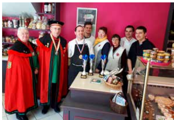
L'équipe de la charcuterie-traiteur "De l'entrée au dessert" a reçu des membres de la Confrérie Cassine des Chevaliers de Saint-Jacques.