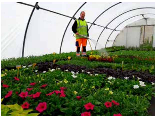
Régis Chevalier, responsable des espaces verts de la ville utilise l'eau de pluie récupérée pour arroser ses 9 000 plants.

À partir de la mi-mai, les rues de la ville s'ornent de milliers de fleurs. Pour le fleurissement de Gorrion, 9 000 plants sont cultivés par les services techniques de la ville depuis octobre.