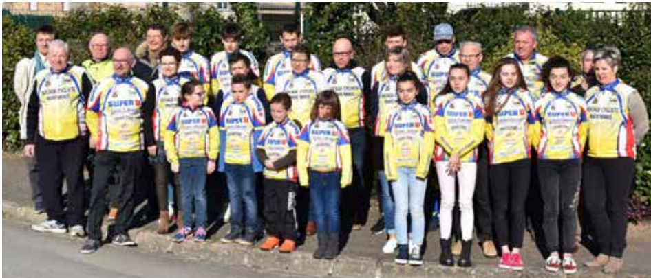
Parmi les coureurs du BCM, les dix jeunes de l'école de vélo vont concourir au Trophée départemental des écoles de vélo.

C'est l'événement sportif du mois. Les jeunes pousses du cyclisme mayennais ont rendez-vous à Gorrion, samedi 4 mai, pour disputer le trophée départemental des écoles de vélo, organisé par le Bocage Cycliste Mayennais.